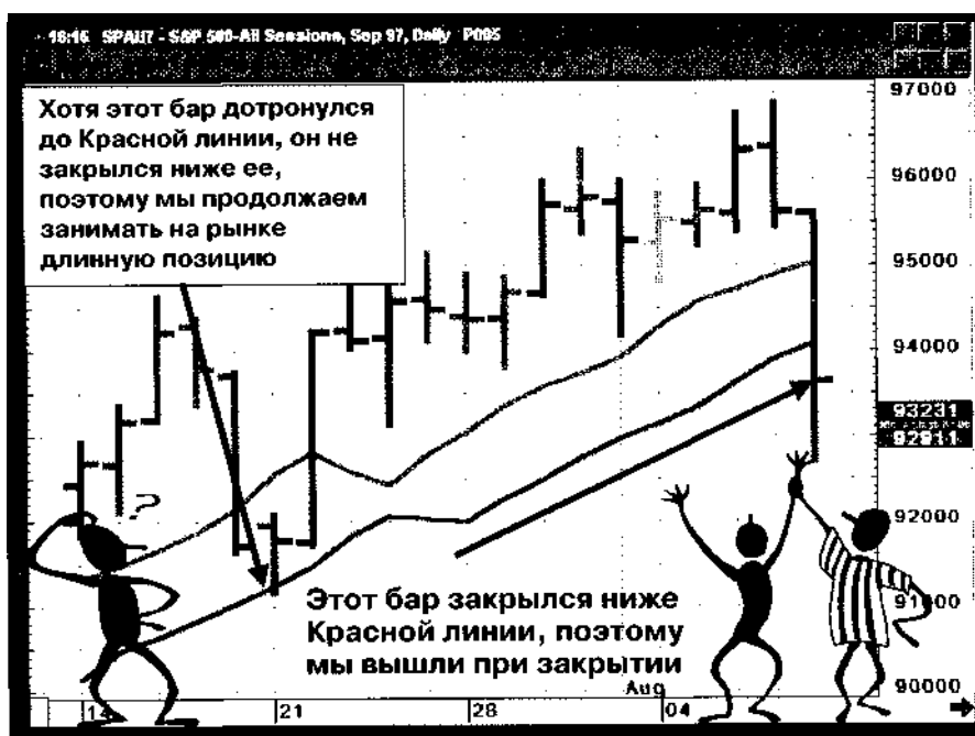
Рис. 9-3 Другой пример стопа на Красной линии