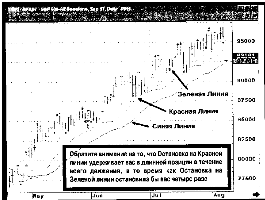
Рис. 9-4 Другой пример остановки на Красной линии

На Рис. 9-3 вы видите другой пример рынка, приближающегося и опускающегося ниже Красной линии, но закрывающегося выше линии, отвергая выход из рынка. Самый правый бар закрылся ниже Красной линии, и мы вышли в этой точке.