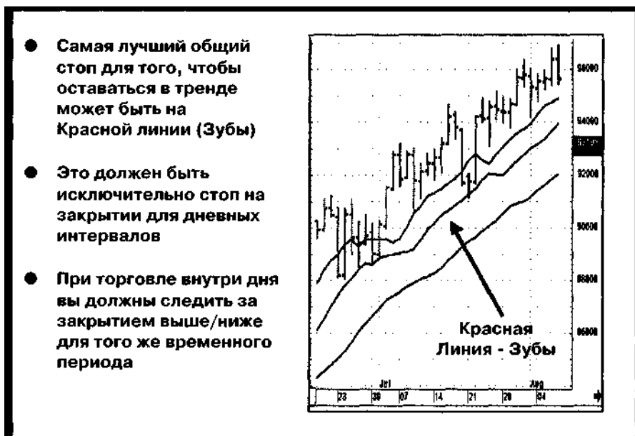
Рис. 9-2 Самый лучший стоп для любых случаев

На Рис. 9-2 вы видите, как несколько раз происходило проникновение сквозь Красную линию, но закрытия ниже Красной линии не было. Если вы торгуете на таком рынке и используете Красную линию в качестве остановки, то вы все еще будете продолжать занимать длинную позицию. Давайте рассмотрим другой пример.