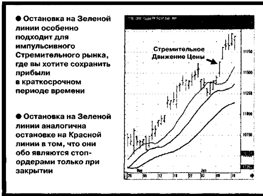
Рис. 9-6 Остановка на Зеленой линии Стремительного рынка

Сейчас мы переходим к нашей последней остановке, которая является исполнительным решением и определяется сигналом противоположного направления. (Рис. 9-7). Это сигнал, который мы реже всего используем, и который является наименее жела-