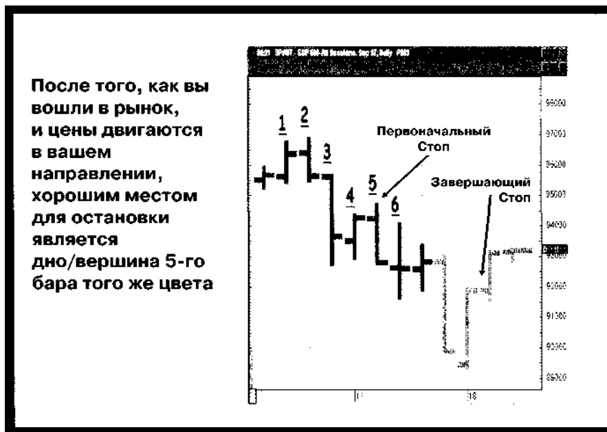
Рис. 9-5 Остановка для пяти последовательных баров одного цвета

Рис. 9-5 иллюстрирует такую остановку. Числа от 1 до 5 указывают первые пять красных баров. Шестой и седьмой бары также являются красными. Наша первая остановка устанавливается над пятым баром. Когда шестой бар имеет более низкий максимум, мы опускаемся как раз чуть выше максимума шестого бара. Седьмой и восьмой бары оказываются серыми барами, что означает, что Движущая Сила все еще двигалась вниз, а Ускорение возрастает. Другими словами Движущая Сила замедляется. Когда это происходит, мы начинаем искать место для получения прибыли. Затем мы получаем замыкающую остановку, которая обычно выводит нас из нисходящего движения на более низком максимуме, и выводит нас из восходящего движения на самом высоком минимуме. Лучшего места для получения прибыли вы просто не найдете.